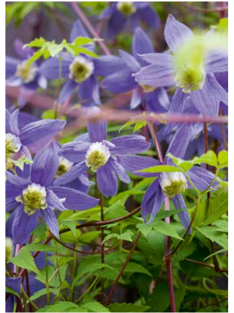
Die Blüten der Waldrebe ( Clematis alpina ) leuchten bei Einbruch der Nacht besonders blau.

Wenn die Laubbäume im Winter keine Blätter mehr haben, fällt die Rinde von Gehölzen besonders ins Auge. Gerade Birken mit ihrer hellen, weissen Rinde erhellen dann den kargen Garten.