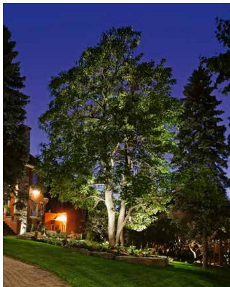
Mit kleinen Strahlen lässt sich der Hausbaum markant in Szene «leuchten».

kann die Artenvielfalt nachtaktiver Tiere beeinträchtigen wie auch Mensch und Pflanzen negativ beeinflussen. Dank neuer technologischer Entwicklungen lassen sich die problematischen Lichtemissionen wirksam reduzieren.