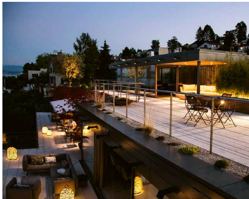
Ausgewogen beleuchtet lädt der Garten zum entspannenden Feierabend ein.