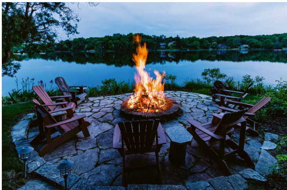
Das kraftvolle Element Feuer lässt sich auf vielseitige Weise in die Gartenlandschaft einbinden.

TROTZ DES STANDORTWECHSELS VOM STEINZEITLICHEN LEBEN IN DER HÖHLE ZUR HEUTIGEN WOHNFORM IM HAUS HAT SICH DER MENSCH SEINE ENGE BINDUNG ZUM ELEMENT FEUER BEWAHRT.